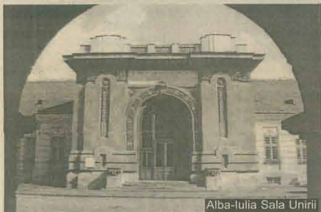
Alba-Iulia Sala Unirii

Vicepreședinte al Societății cultural-patriotice „Avram Iancu” din România