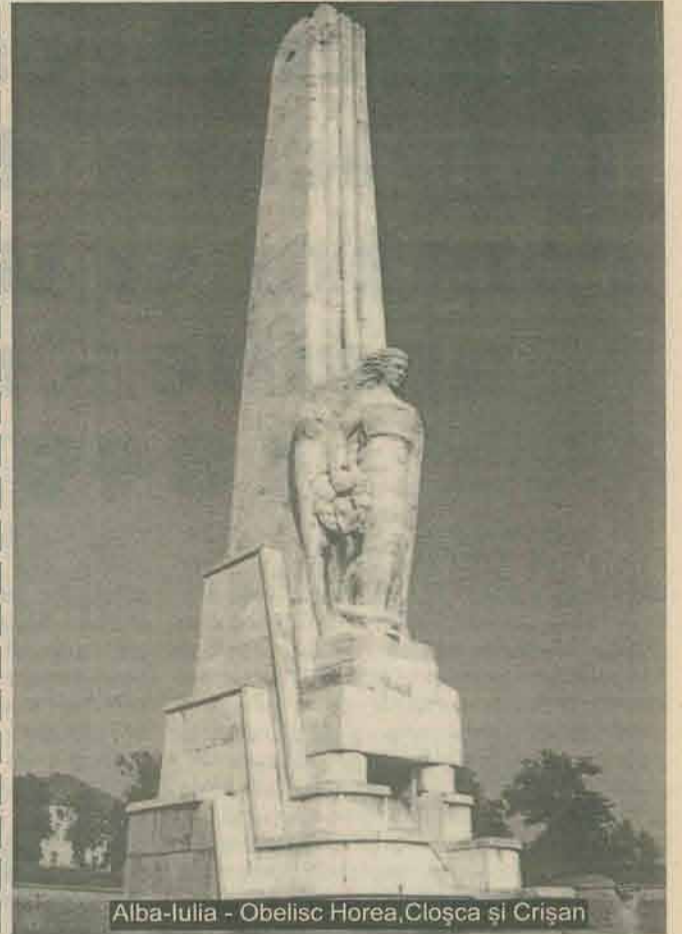
Alba-Iulia - Obelisc Horea, Cloșca și Crișan