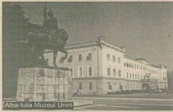
Alba-Iulia Muzeul Unirii