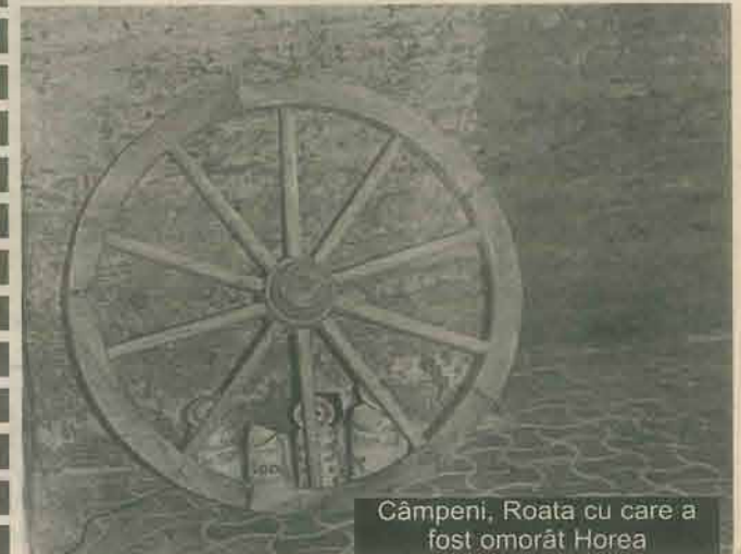
Cămpeni, Roata cu care a fost omorât Horea