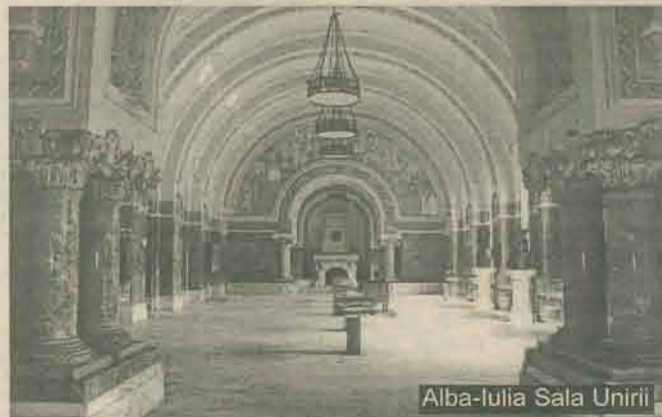
Alba-Iulia Sala Unirii