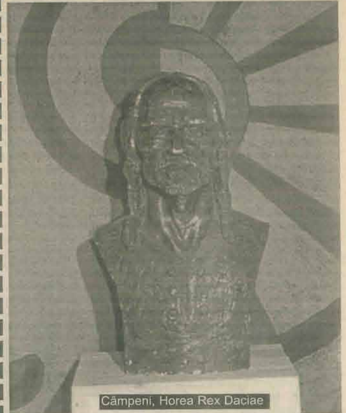
Cămpeni, Horea Rex Daciae