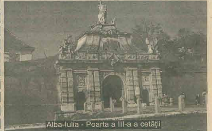
Alba-Iulia - Poarta a III-a a cetății