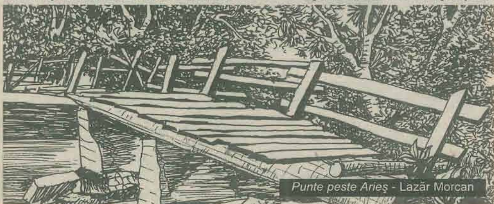
Punte peste Arieș - Lazăr Morcan