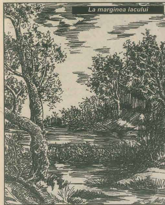
La marginea lacului