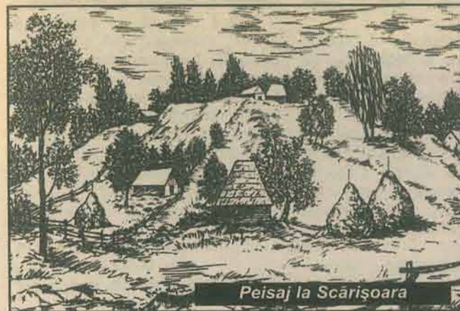
Peisaj la Scărișoara