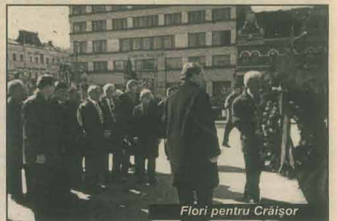
Flori pentru Craișor