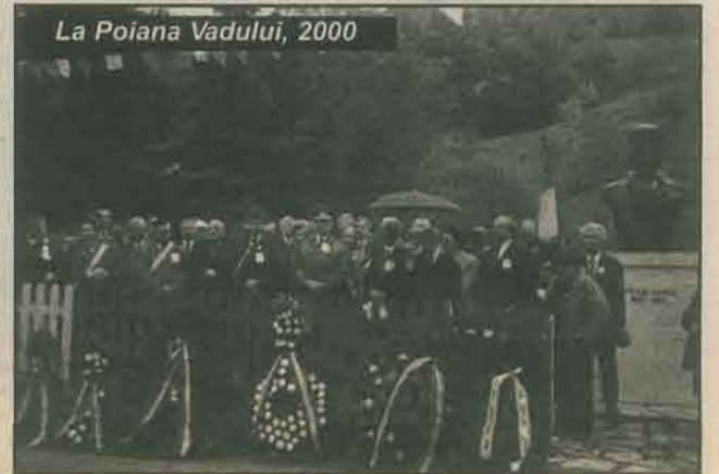
La Poiana Vadului, 2000