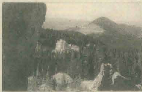
Un „castel” din Apuseni: Cabana Muntele Băişorii

Rezervațiile, ca zone științifice, vor fi în județul Alba - Complexul carstic Ocobale Scărișoara, valea superioară Gârda Seacă și Casa de Piatră; în județul Bihor: valea superioară a Aleului cu Sărtoarea Bohodeiului, Pietrele Boghii, Cetățile Ponorului, Valea Galbenei, Valea Sighiștelului și Groapa Ruginoasă; în