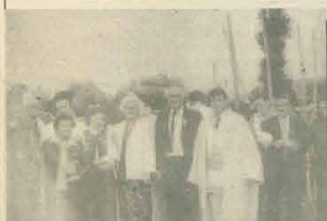
și, desigur, la Țebea...