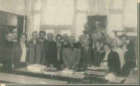
la Câmpia Turzii,