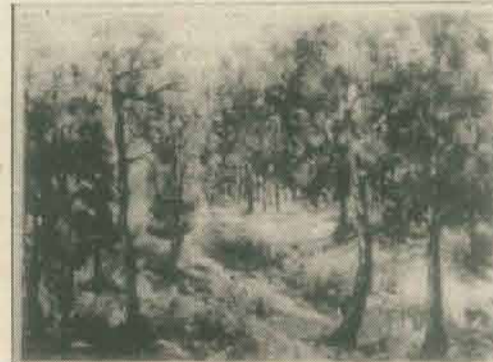
„Pe aici a trecut lăncul“

Dorința cea mai arzătoare a tuturor celor ce ajung la Câmpeni, turiști atât din țară cât și din străinătate, este aceea de a vedea Vidra de Sus, satul natal al lui Avram Iancu, purtând astăzi numele eroului, ca și faimosul târg de fete de pe Muntele Găina. Cei care vin dinspre Abrud se îndreaptă, de altfel, direct spre aceste locuri, în timp ce marea majoritate a celor ce vin dinspre Turda, ținând cursul Arieșului, își continuă drumul spre Albac pentru a savura frumusețile văii râului de aur. De aici unii se întorc pentru a alerga și înspre cuibul vulturului de la Vidra, iar alții își continuă drumul până la Gârda de Sus, de unde, cotind spre stânga, intră în valea Arieșului Mic, pe care îl conduce.