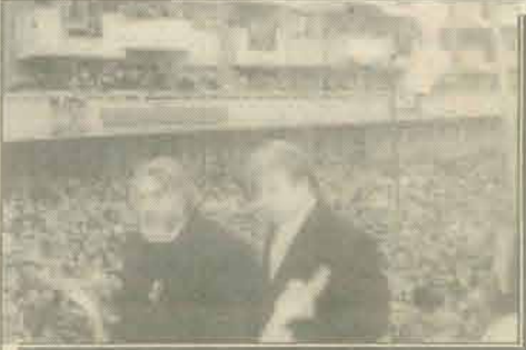
Vadim Tudor și Adrian Păunescu, tribuni ai vremurilor noastre...