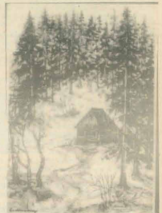
„Peisaj la Horea“

În jurul jocurilor se desfășura totodată și un grandios târg de produse locale: sumane, tunde, cojoace, căciuli, opinci, donițe, fluieri, tulnice, linguri de lemn, coșărci, precum și de mărfuri și băuturi aduse de la Abrud, Oradea, Beiuș, Arad, Cluj. Târgul de la Găina era, deci, nu numai o colosală manifestație și expoziție folclorică și etnografică, ci și o vastă acțiune