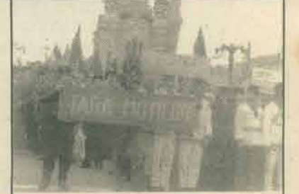
Piața Avram Iancu din Cluj-Napoca, devenită capitală a Țării Moșilor.

Pagină realizată de Vasile CRISTEA și Vasile TUTULA