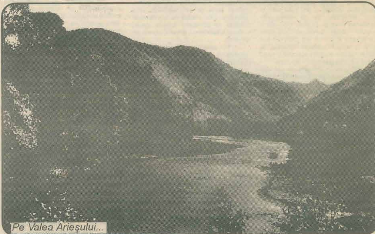
Pe Valea Arieșului...